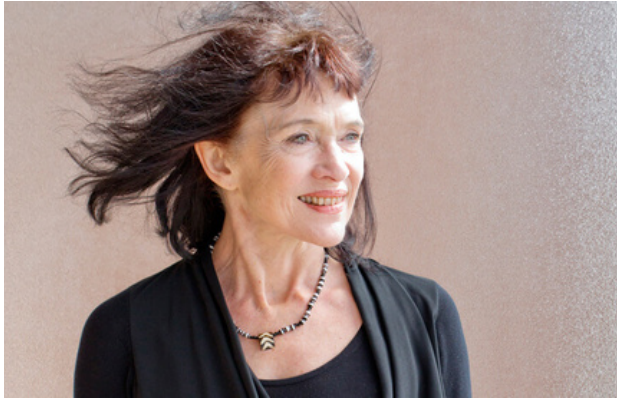
Nancy Huston