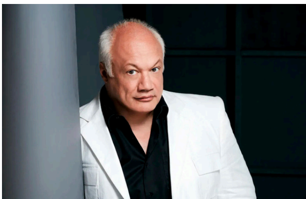
Éric-Emmanuel Schmitt

Les textes écrits par les participant-es seront portés sur scène par les jeunes et Maleck, sur des compositions originales signées Noé Gillerot. À travers cette proposition inédite, le festival affirme sa volonté de renforcer la place des jeunes publics au cœur de sa programmation.