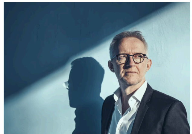
David Van Reybrouck

Impossible aussi d'interroger ce qui nous arrive sans aborder la montée du populisme, les mécanismes de désinformation et l'impact des réseaux sociaux, sujets qui seront notamment explorés avec Gérald Bronner .