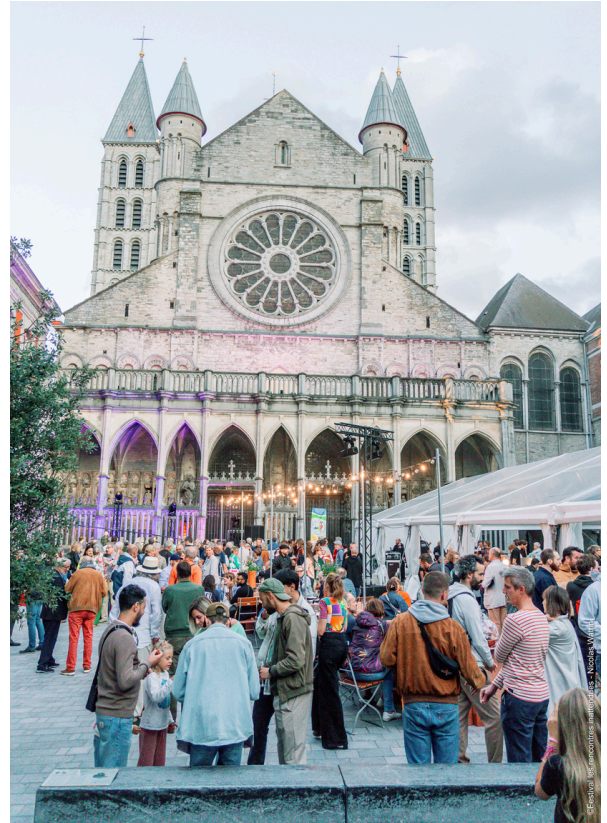
Les rencontres Inattendues, édition 2025

Entre débats, concerts, spectacles, performances, ateliers philosophiques, créations participatives et émissions en direct, le festival invitera chacun·e à prendre