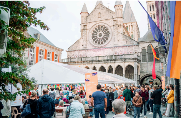
Les rencontres Inattendues, édition 2025

Dans cette volonté de rendre la création et la réflexion accessibles au plus grand nombre, le festival proposera également, durant la semaine précédant l'événement, plusieurs stages et ateliers ouverts à toutes et tous, sans prérequis. Atelier chant, théâtre, ukulélé, travail des rythmes ou encore pratiques collectives autour de la musique et de la scène permettront aux participant-es d'expérimenter le festival de l'intérieur, dans un esprit de découverte, de partage et de convivialité.